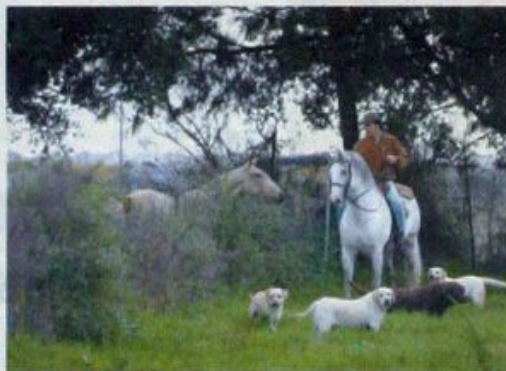
... não são bons guarda ... não possuem uma natureza agressiva...

O ideal é aconselhar-se com um criador que conheça raça a fundo e lhe poder dar maiores garantias. Por vezes a tendência para querer fazer um "negócio da China" revela-se, com o passar do tempo, num enorme disparate. 🐾