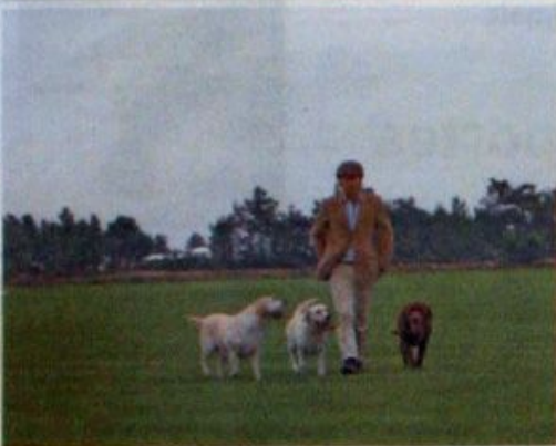
... para além da cor não existem diferenças...