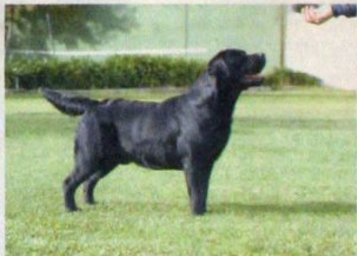
... -tendem a ser muito dóceis com as crianças...