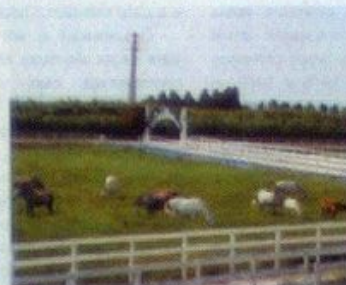
Criação de cavalos e éguas