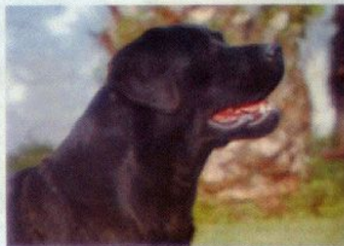
Daly da Mata D'el Rei