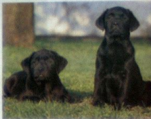
"...tenho em pensamento fazer o melhor pela raça..."