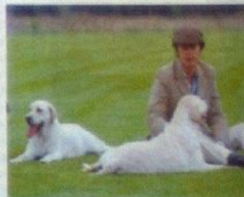
"...foram criados para cobrar..."