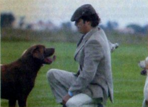
... numa ninhada podem sair as três cores...