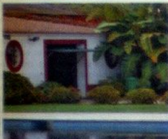
No coração do Ribatejo