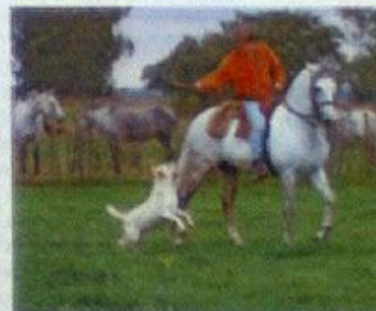
"...é um cão fácil de ensinar..."